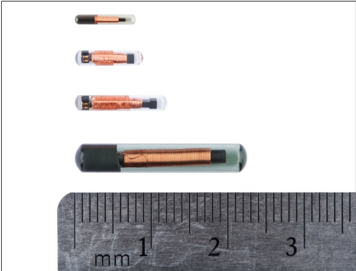
Abb. 2: Pit Tag (Passive Integrated Transponder).